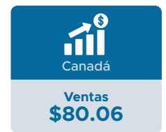
Cifras en millones de dólares estadounidenses.